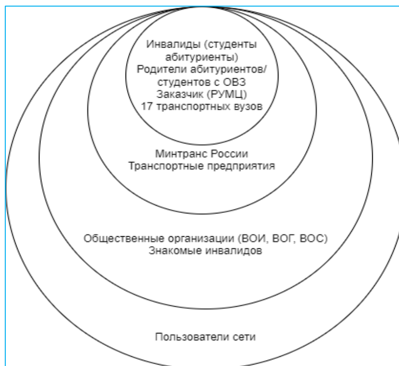
Рис. 2 – Диаграмма стейкхолдеров проекта

На основе анализа были подготовлены карточки стейкхолдеров, выявлены их интересы и сформулированы ценностные предложения (Таблица 1).