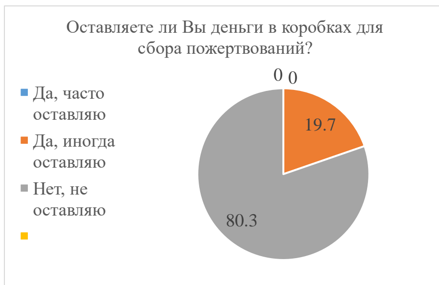
Рисунок 4 – Результаты ответа на вопрос «Оставляете ли Вы деньги в коробках для сбора пожертвований?»

Лишь 19,7% респондентов ответили, что оставляют деньги в коробках для пожертвования, а 80,3% не оставляют вовсе (Рис. 4).