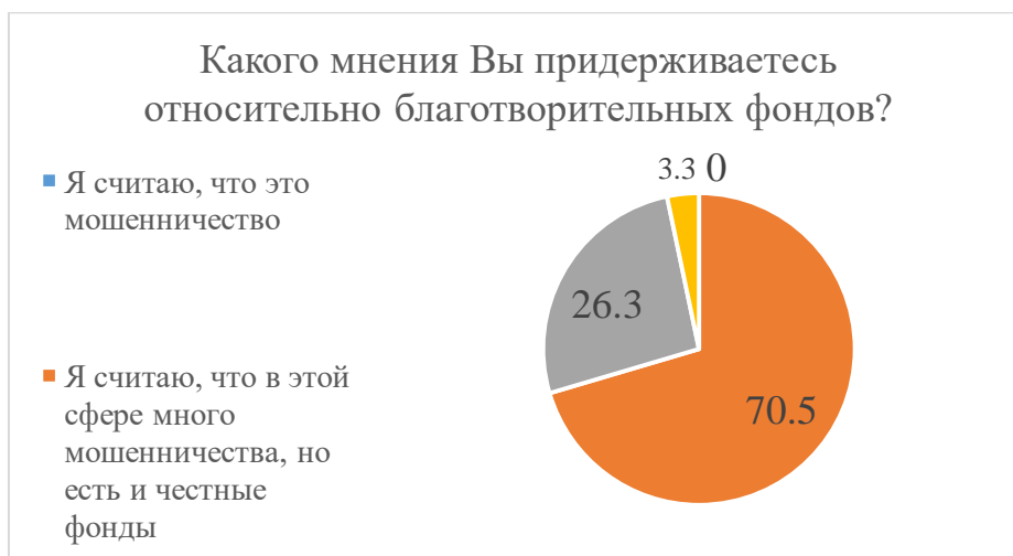
Рисунок 5 – Результаты ответа на вопрос «Какого мнения Вы придерживаетесь относительно благотворительных фондов?»

Проводимое исследование показала, что 70,5% респондентов считают, что в сфере благотворительности много мошенничества и лишь 3,3% опрошенных полностью доверяют благотворительным фондам и уверены, что смогут отличить настоящий фонд от мошенников (Рис. 5).