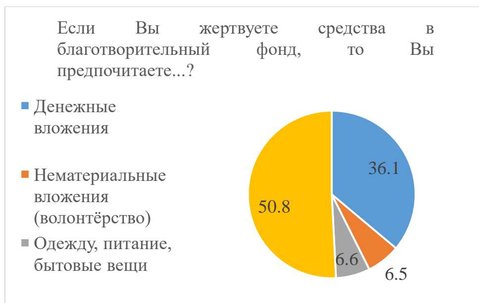
Рисунок 2 – Результаты ответа на вопрос «Если Вы жертвуете средства в благотворительный фонд, то Вы предпочитаете...?»

23% из всех опрошенных ответили, что на их выбор влияет предложение безналичных пожертвований в киосках самообслуживания и 77% ответили, что не влияет (Рис.3).