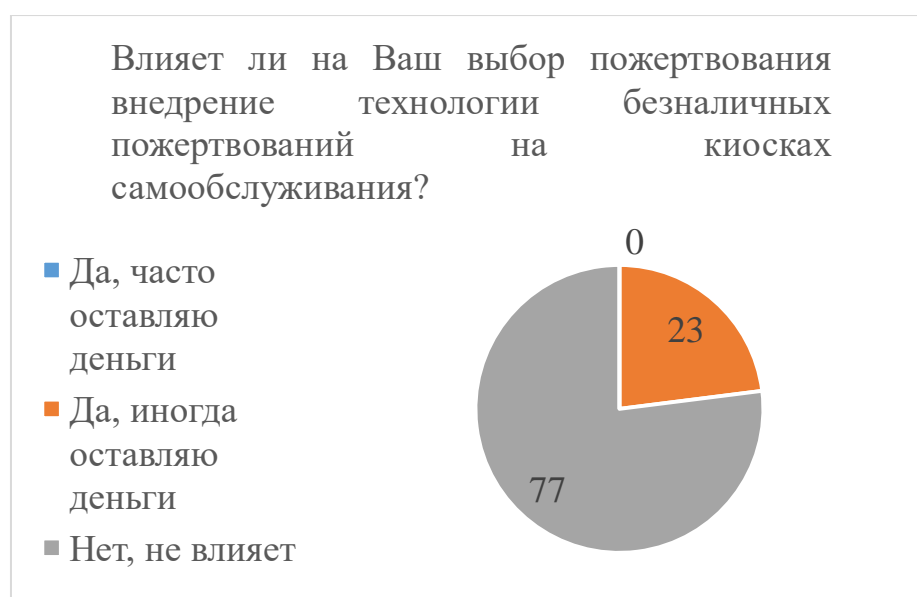
Рисунок 3 – Результаты ответа на вопрос «Влияет ли на Ваш выбор пожертвования внедрение технологии безналичных пожертвований на киосках самообслуживания?»

23% из всех опрошенных ответили, что на их выбор влияет предложение безналичных пожертвований в киосках самообслуживания и 77% ответили, что не влияет (Рис.3).