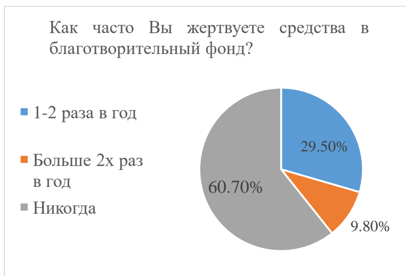
Рисунок 1 – Результаты ответа на вопрос «Как часто вы жертвуете средства в благотворительный фонд?»

Добровольные пожертвования граждан и юридических лиц также составляют существенный вклад в финансирование благотворительных проектов. Мы провели опрос среди жителей Челябинска и Челябинской области, на сегодняшний день в нём участвовали 453 человека, преимущественно от 18 до 23 лет, опрос проводился посредством «Google Форм». Опрос показал, что лишь 29,5% опрошенных жертвуют средства в благотворительный фонд 1-2 раза в год, больше 2х раз жертвуют 9,8% респондентов, 60,7% опрошенных не жертвуют вовсе (Рис. 1).