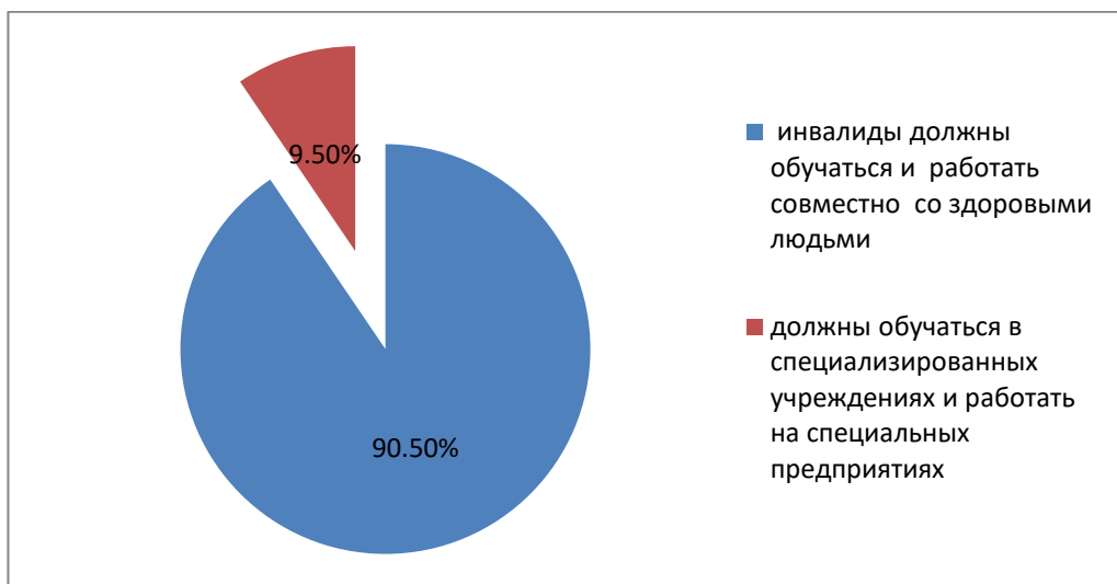
Рис.2. Распределение ответов на вопрос: «Как Вы считаете, должны ли инвалиды обучаться, работать совместно со здоровыми людьми, или же они должны обучаться в специализированных учреждениях и работать на специальных предприятиях?»

Мы уже сказали выше, что успешность социальной интеграции во многом зависит и от их желания выйти из ситуации социального исключения. Большинство респондентов считают, что инвалиды должны учиться и работать совместно со здоровыми людьми (см. рис. 2).