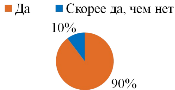
Рис. 2 – Ответы участников Квиза на вопрос «Понравилось ли мероприятие?»