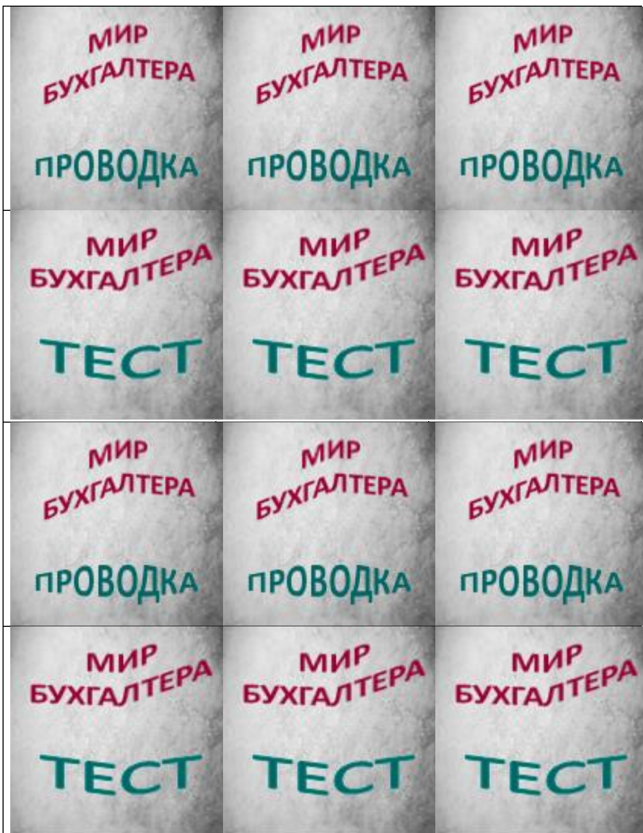
Образцы карточек (дизайн карточек может быть изменен)