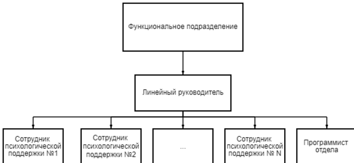
Рисунок 1 – Структура функционального подразделения

Руководитель среднего звена назначен для контроля работы нижестоящего руководства и отвечает за выполнение работы в отдельно взятом регионе/городе Российской Федерации (Рисунок 2).